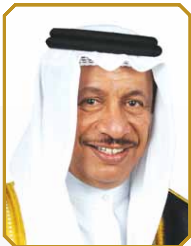
الشيخ جابر مبارك الحمد الصباح رئيس مجلس الوزراء

Sheikh Jaber Mubarak Al-Hamad Al-Sabah Prime Minister