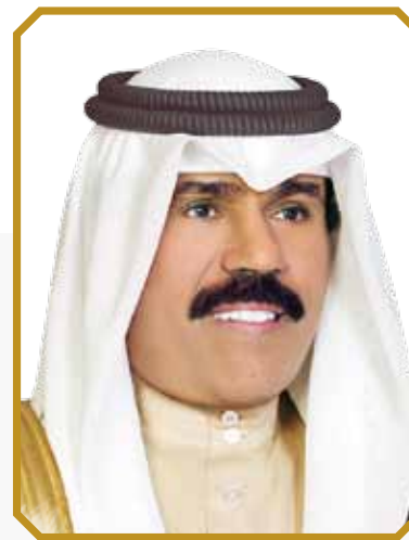
سمو الشيخ نواف الأحمد الجابر الصباح ولي عهد دولة الكويت

Sheikh Jaber Mubarak Al-Hamad Al-Sabah Prime Minister