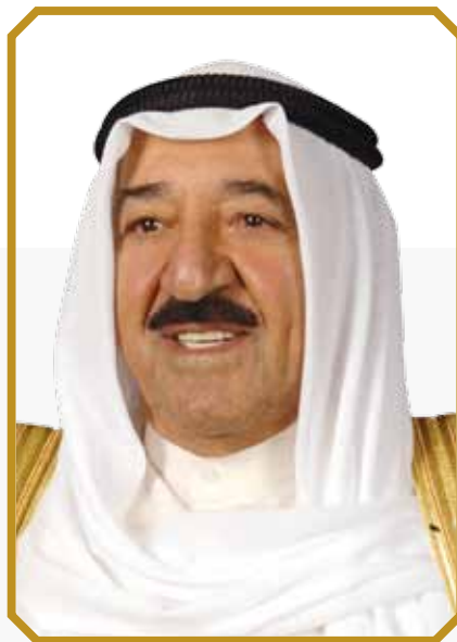
صاحب السمو الشيخ صباح الأحمد الجابر الصباح أمير دولة الكويت

Sheikh Sabah Al-Ahmad Al-Jaber Al-Sabah Amir of the State of Kuwait